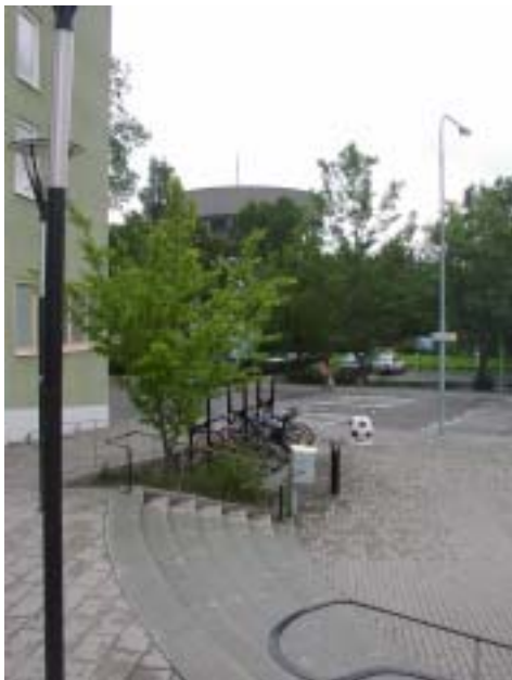
Vattentornets tak är ungefär 70 meter över havet och skulle först stuckit upp ur havet av dagens Bergshamra.

Men nu börjar det hända saker här - jordytan är avlastad - och börjar stiga upp ur havet. För femtusentals år sedan hade de markområden som idag ligger runt femtio meter över havsnivån börjat sticka upp ur vattnet. Om vattentornet i Bergshamra hade funnits då, hade mer än halva tornet varit ovanför vattnet. Kvarnkullen däremot, som nu är drygt fyrtio meter över havet, stack ännu inte upp. För Bergshamra torg, idag 28 meter över havet, dröjde det ytterligare några hundra år, kanske